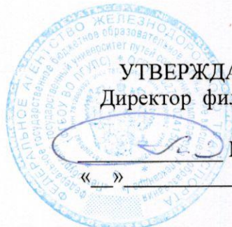
График промежуточной аттестации

по основной образовательной программе среднего профессионального образования по ППССЗ